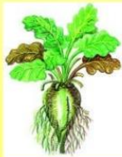
Жіпшеқұртпен зақымданған қант қызылшасы

тудыратын паразит жәндіктер Шаруашылыққа зияны көп Мөлшері 1мм-ден аспайды