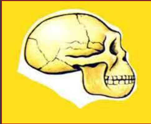
Питекантроп, объем мозговой коробки 900-1100 см 3 .