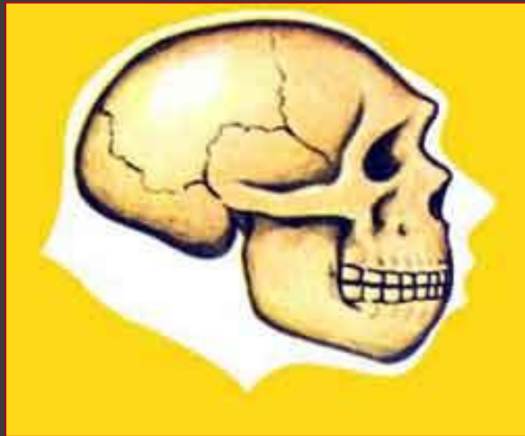
Неандерталец, объем мозговой коробки около 1400 см 3 .