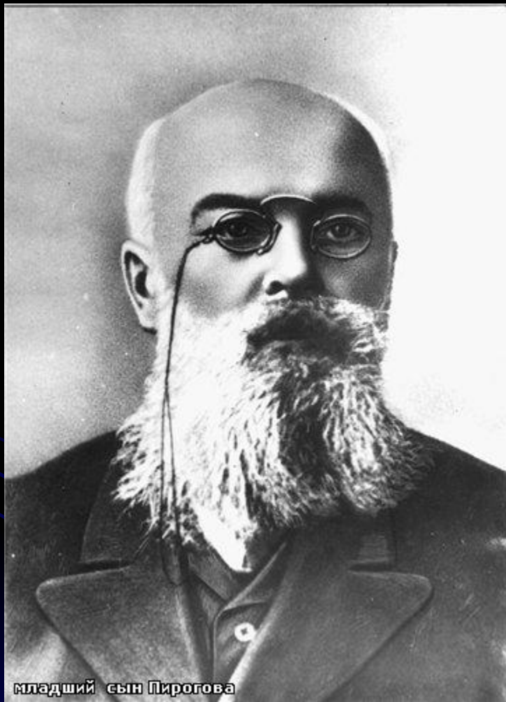
младший сын Пирогова