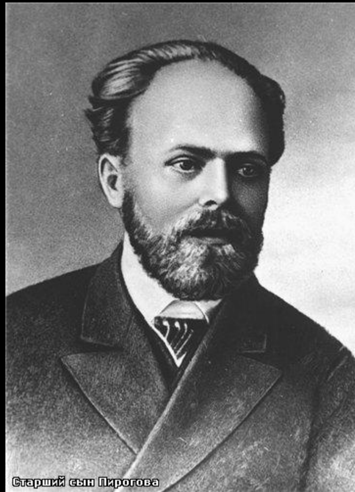
Старший сын Пирогова