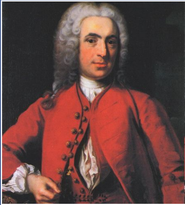
Карл Линней, 1707-1778