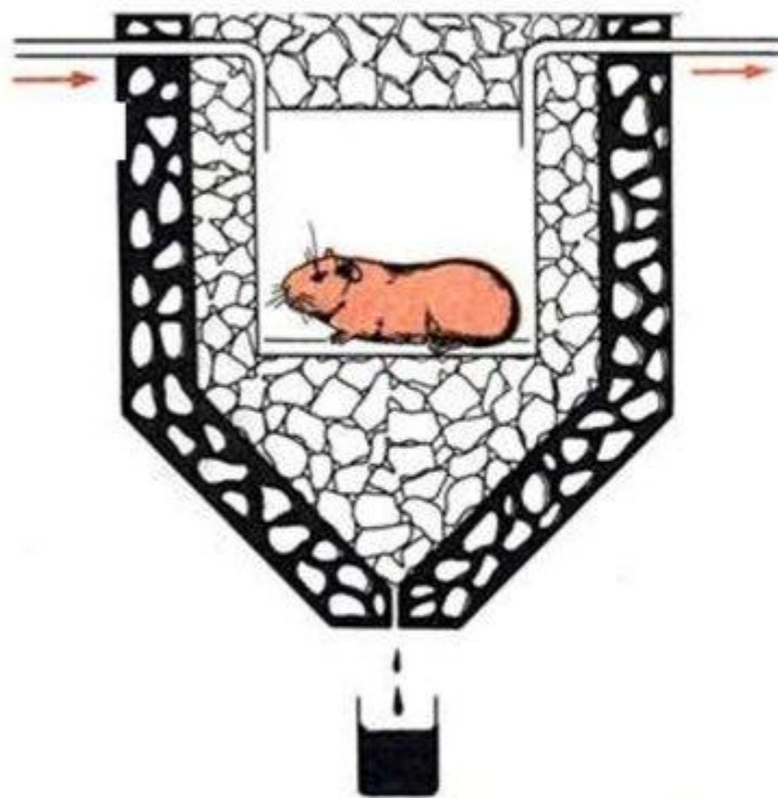
Лавуазье (конец VIII в)

БИОКАЛОРИМЕТР ДЛЯ МЕЛКИХ ЖИВОТНЫХ (тепло вызывает таяние льда; учитывается объём талой воды)