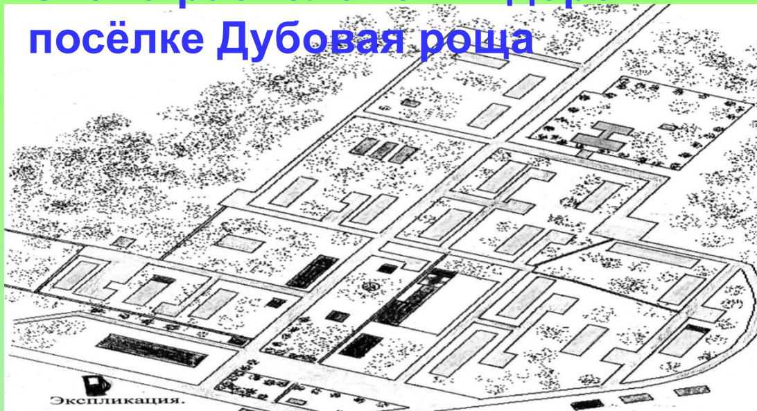
Схема расположения дорог в посёлке Дубовая роща