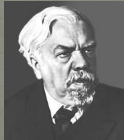
Академик С.А. Чаплыгин