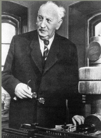
Академик А.Ф. Иоффе