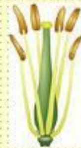
Расположение тычинок и пестиков

Растения разделяют на группы: • овощные (капуста, редька, редис, хрен, репа); • масличные (горчица, рапс); • лекарственные (пастушья сумка, гулявник лекарственный); • сорные (редька дикая, сурепка обыкновенная, ярутка полевая).