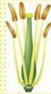
Расположение тычинок и пестиков

Растения разделяют на группы: • овощные (капуста, редька, редис, хрен, репа); • масличные (горчица, рапс); • лекарственные (пастушья сумка, гулявник лекарственный); • сорные (редька дикая, сурепка обыкновенная, ярутка полевая).