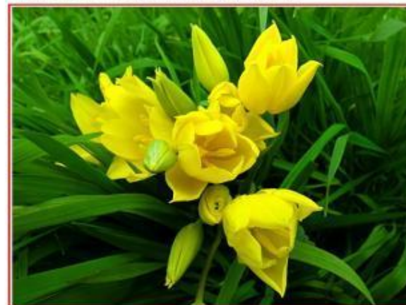
Тюльпан Шренка (Геснера) - Tulipa schrenkii Regel ( Tulipa gesneriana L.)

«Красная книга Новосибирской области»