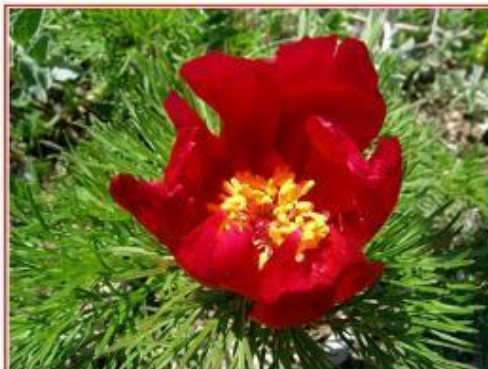
Гвоздика танжикская (узбекская) - Physcia tenuifolia L.

«Красная книга Новосибирской области» © Игорь Торганкин torgachkin@novosib.ru