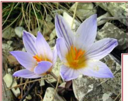
Шафран двухцветный (крымский) - Crocus albicus Mill. s. str. ( C. bairicus Trautv.) Ruting

«Красная книга Новосибирской области»