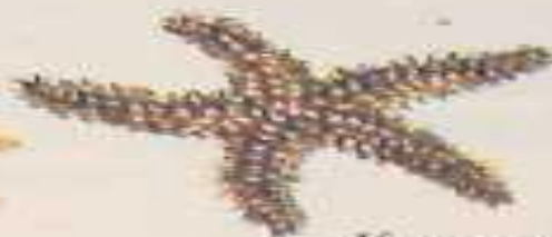
Обыкновенная морская звезда