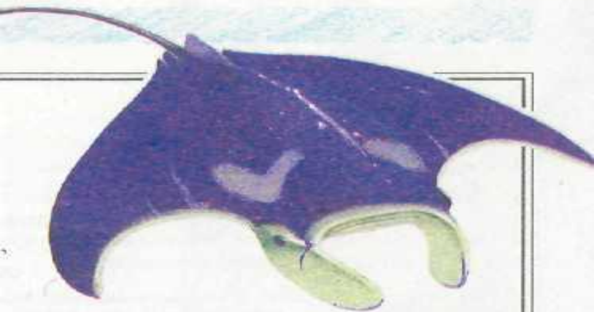
Манна — наиболее крупный из ныне живущих скатов; ширина тела достигает 6,5 м.