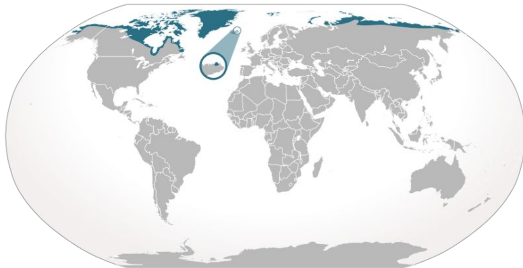
Ареал обитания белых медведей