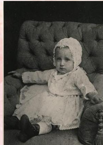
А. Ахматова в детстве