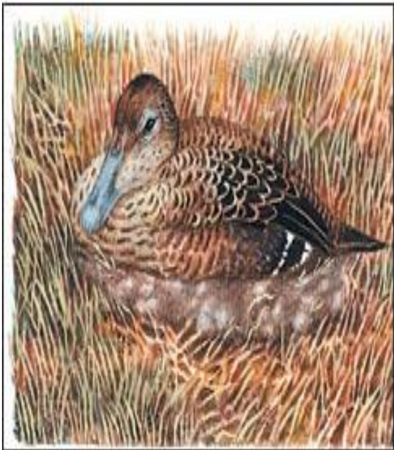
Рис.57. Примеры адаптаций: 1 — гага на гнезде: ее покровительственная окраска делает птицу малозаметной; 2 — бабочка березовой пяденицы на коре