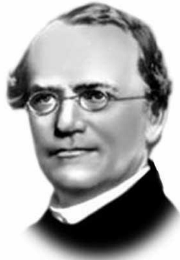
МЕНДЕЛЬ Грегор Иоганн 1822-1884