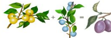
алыча + терн = слива