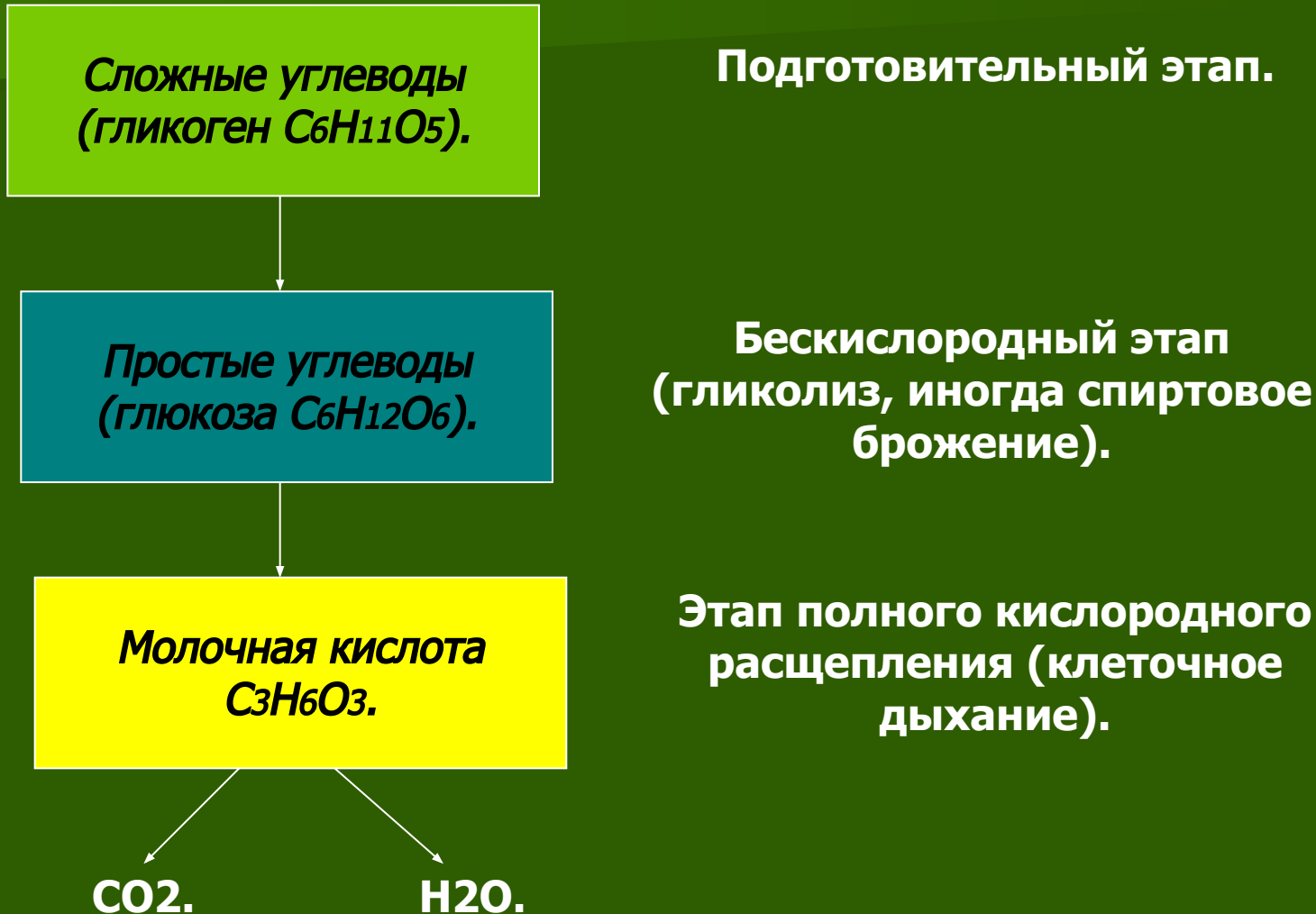
Схема стадий энергетического обмена.