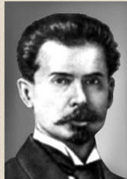
Виноградский С. И.

С.Н.Виноградский в 1887 году впервые открыл процесс хемосинтеза.