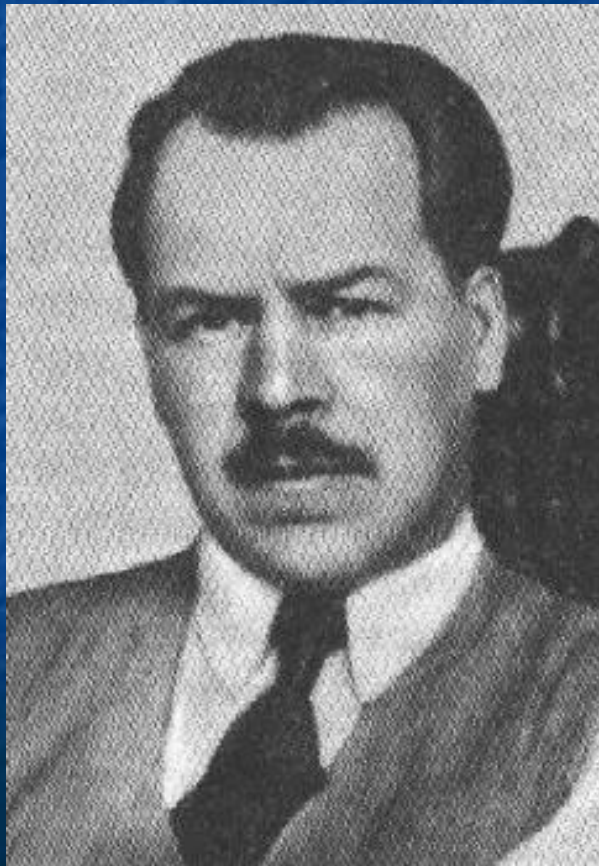
Н. И. Вавилов