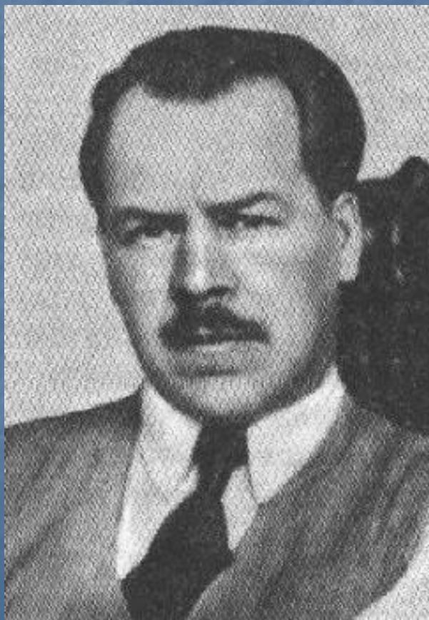
Н. И. Вавилов