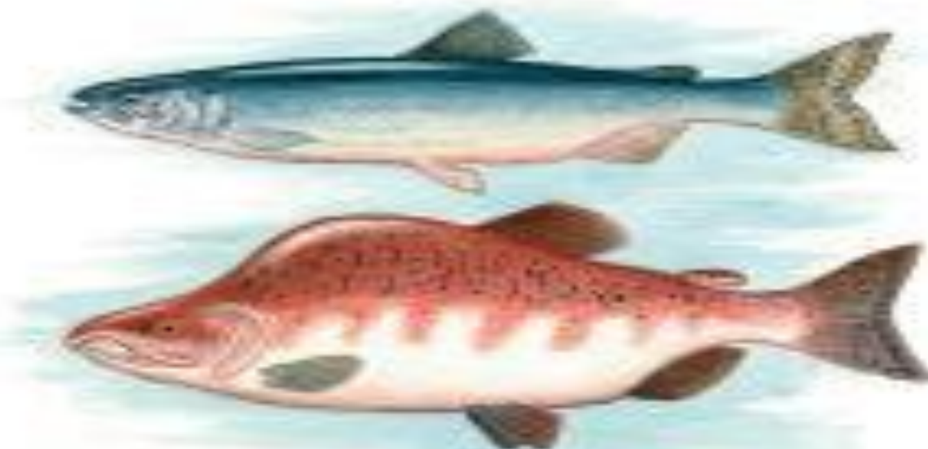
Рис. 123. Горбуша- серебрянка и окраска самца горбуши перед нерестом