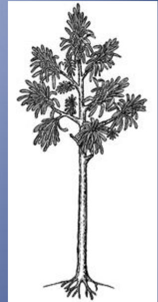
Рисунок 4.3.5.1. Вымершие кордаиты.

Хвойные – большей частью однодомные растения. Пыльца образуется в микроспорангиях, расположенных на микроспоробиллах, иногда собранных в шишках (у сосны обыкновенной – около 5 мм в диаметре); яйцеклетки образуются на мегастробилах, собранных в шишки (у калифорнийской сосны Ламберта их размеры достигают 65 см). Опыление происходит при помощи ветра. Пыльцевые зёрна прорастают, достигая яйцеклетки; наличие капельножидкой воды для этого не обязательно. После оплодотворения развивается зародыш, имеющий от 2 до 15 семядолей. У сосны оплодотворение происходит через год после опыления, а на созревание требуется ещё полтора года. Семена развиваются «голыми» – на поверхности семенных чешуй шишек. К моменту созревания чешуйки отгибаются, и семена (нередко крылатые) высыпаются наружу.