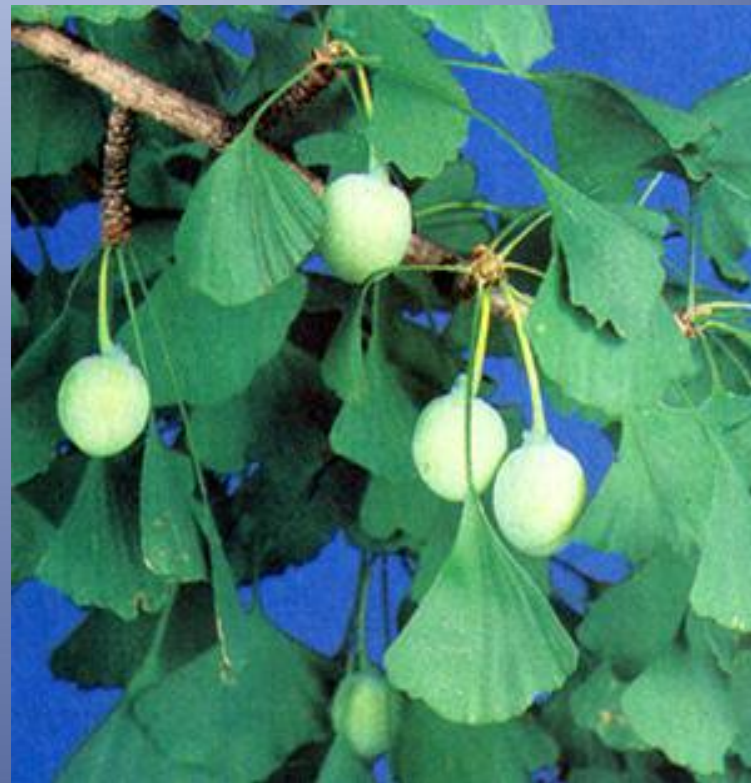
Рисунок 4.3.4.2. Ветка гинкго.

Гинкго двулопастный – это двудомное дерево высотой 30–40 м и толщиной до 1 м с раскидистой кроной. Веерообразные листья напоминают по форме папоротник , и имеют своеобразный, архаичный тип жилкования – дихотомическое (каждая жилка ветвится на две, которые в свою очередь также ветвятся на две и т.д.). Оранжево-жёлтые семена имеют мясистую кожуру с неприятным запахом; их длина – 2–3 см. Внутреннее маслянистое сладкое ядро употребляется китайцами в пищу.