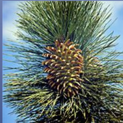
Рисунок 4.3.1.2. Женская шишка сосны Культера.

Голосеменные известны с верхнего девона Голосеменные известны с верхнего девона. В карбоне Голосеменные известны с верхнего девона. В карбоне и перми Голосеменные известны с верхнего девона. В карбоне и перми встречаются представители большинства порядков, а на мезозой приходится их расцвет. Древнейшими из семенных растений являются прогимноспермы (Progymnospermatophyta). Они сочетали в себе эволюционно продвинутое строение стебля с примитивными боковыми побегами, мало чем отличавшимися от побегов псилофитов. Вместо настоящих листьев у них развивались вильчатые безлистные веточки. Прогимноспермы, по-видимому, размножались всё ещё спорами, но уже находились на пути к формированию семян.