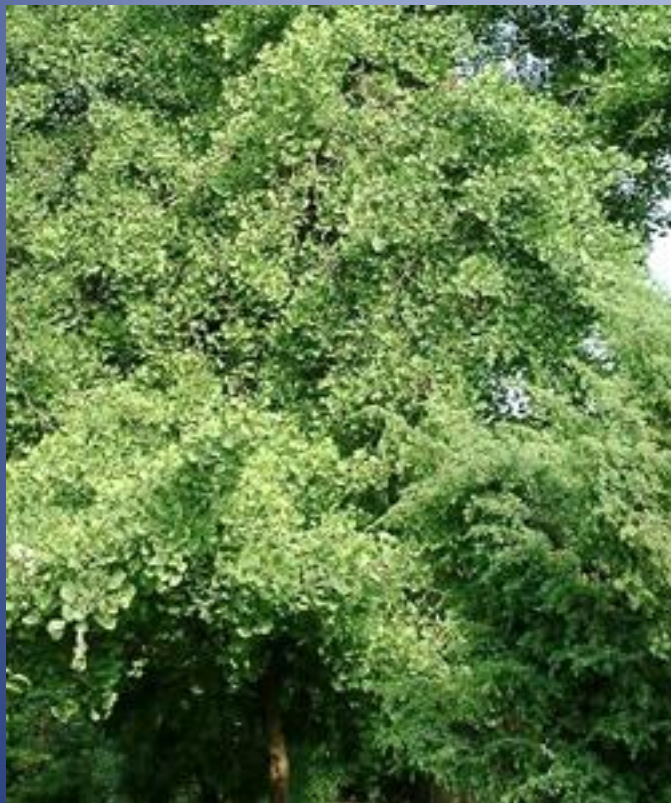
Рисунок 4.3.4.1. Гинкго двулопастный.

Гинкговые – своеобразные «ископаемые динозавры» среди растений. Из 10 родов, известных с перми , до настоящего времени уцелел только один вид – гинкго двулопастный, сохранившийся в некоторых районах Восточной Азии.