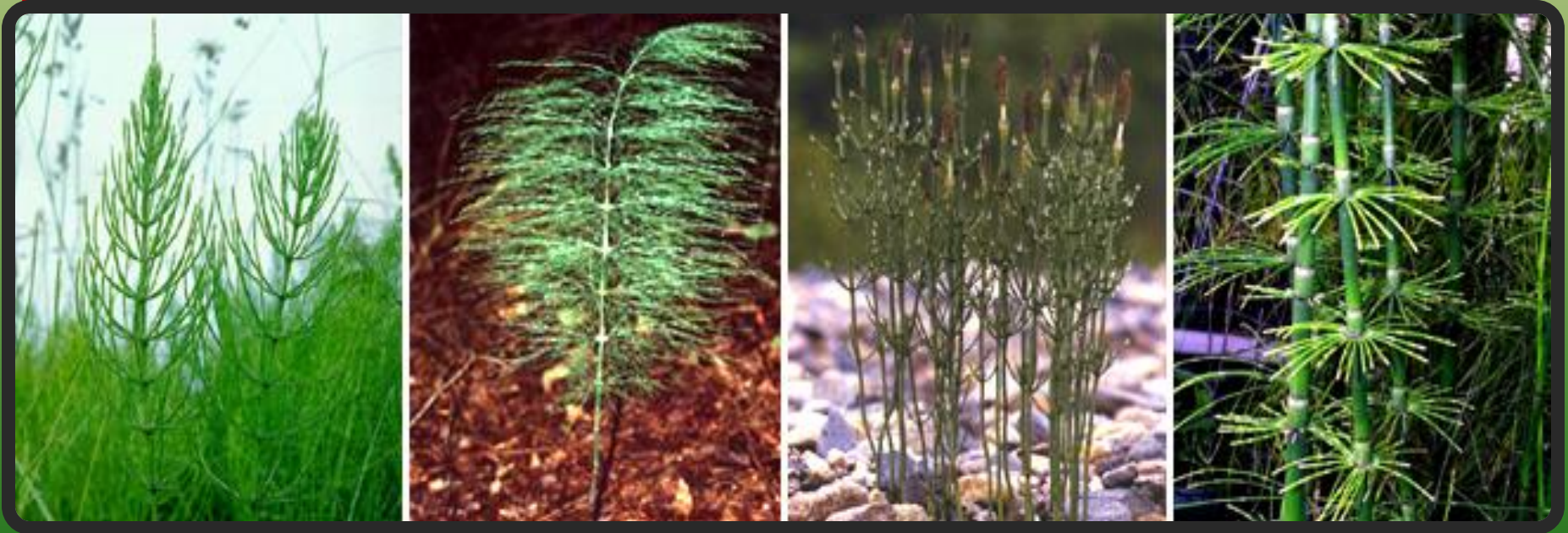
Слева направо: хвощ полевой, хвощ лесной, хвощ болотный, хвощ гигантский

Хвоцевидные (Sphenophyta), известные также как клинолистовидные или членистостебельные, – отдел высших растений, близкий к папоротниковидным. К настоящему времени сохранился единственный род этих растений – хвощ, насчитывающий около 30 видов, распространённых по всему земному шару, кроме Австралии и Новой Зеландии.