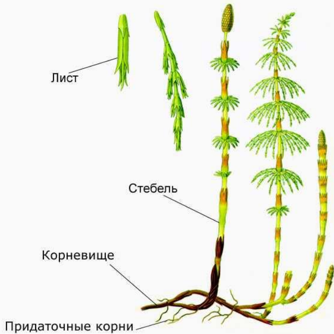
Вегетативные органы хвоща