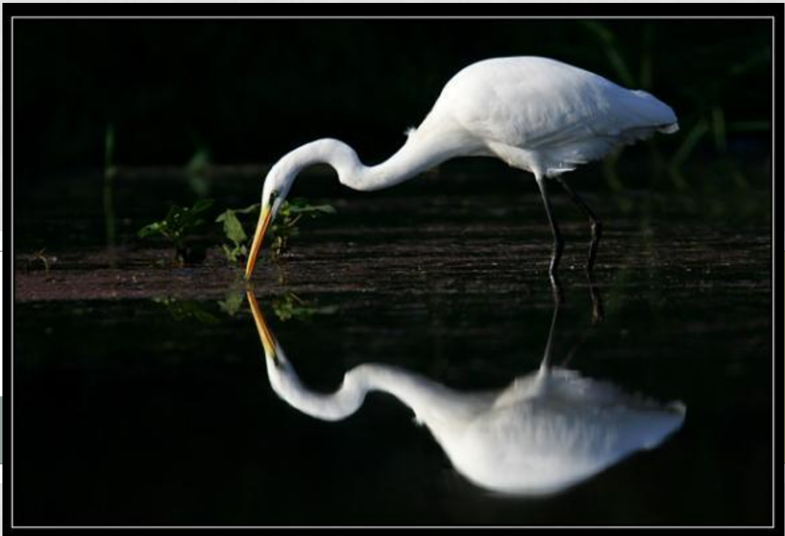
БОЛЬШАЯ БЕЛАЯ ЦАПЛЯ.