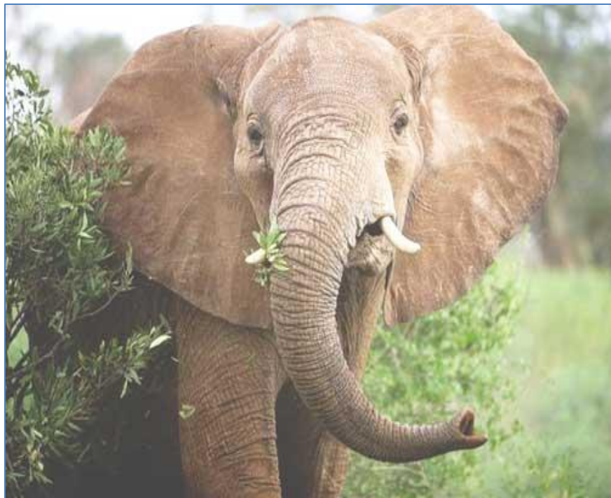
Саванный африканский слон

Африканский слон делится на два подвида: саванный и лесной, отличающиеся спецификой образа жизни и внешнего вида.