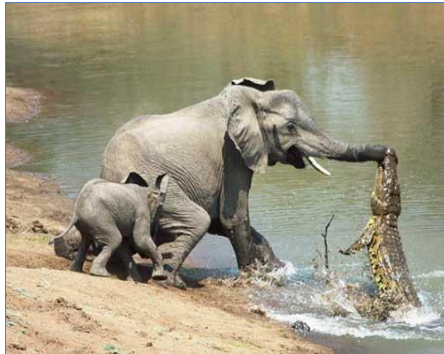
Лесной африканский слон