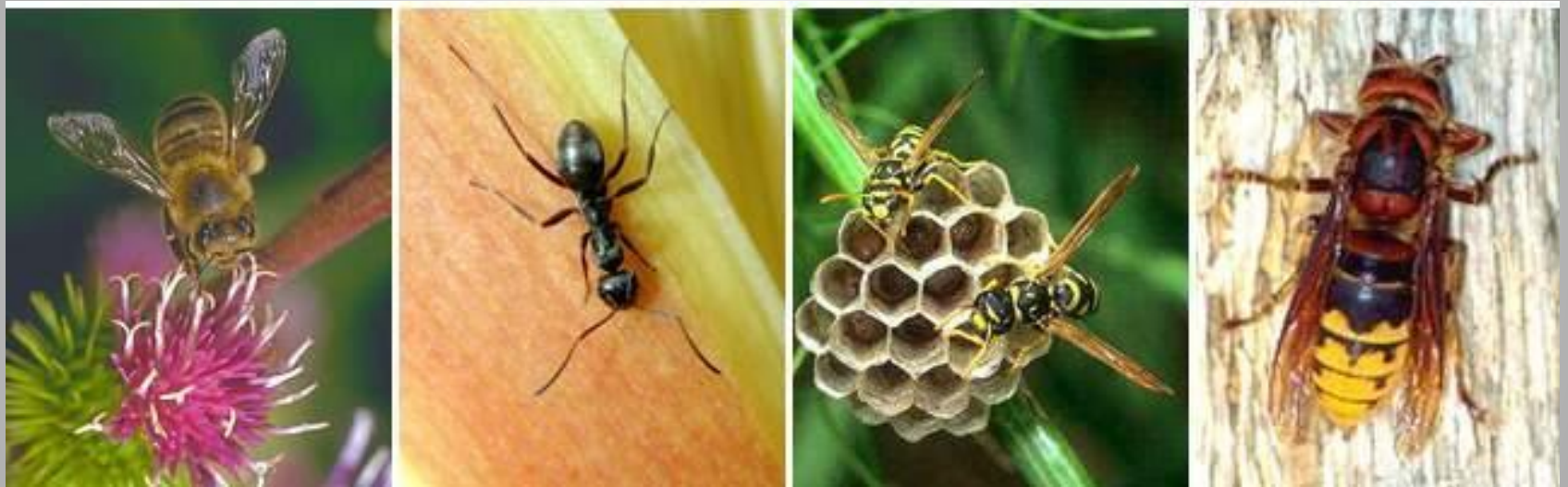
Пчела медоносная, чёрный садовый муравей, оса-полист, шершень.