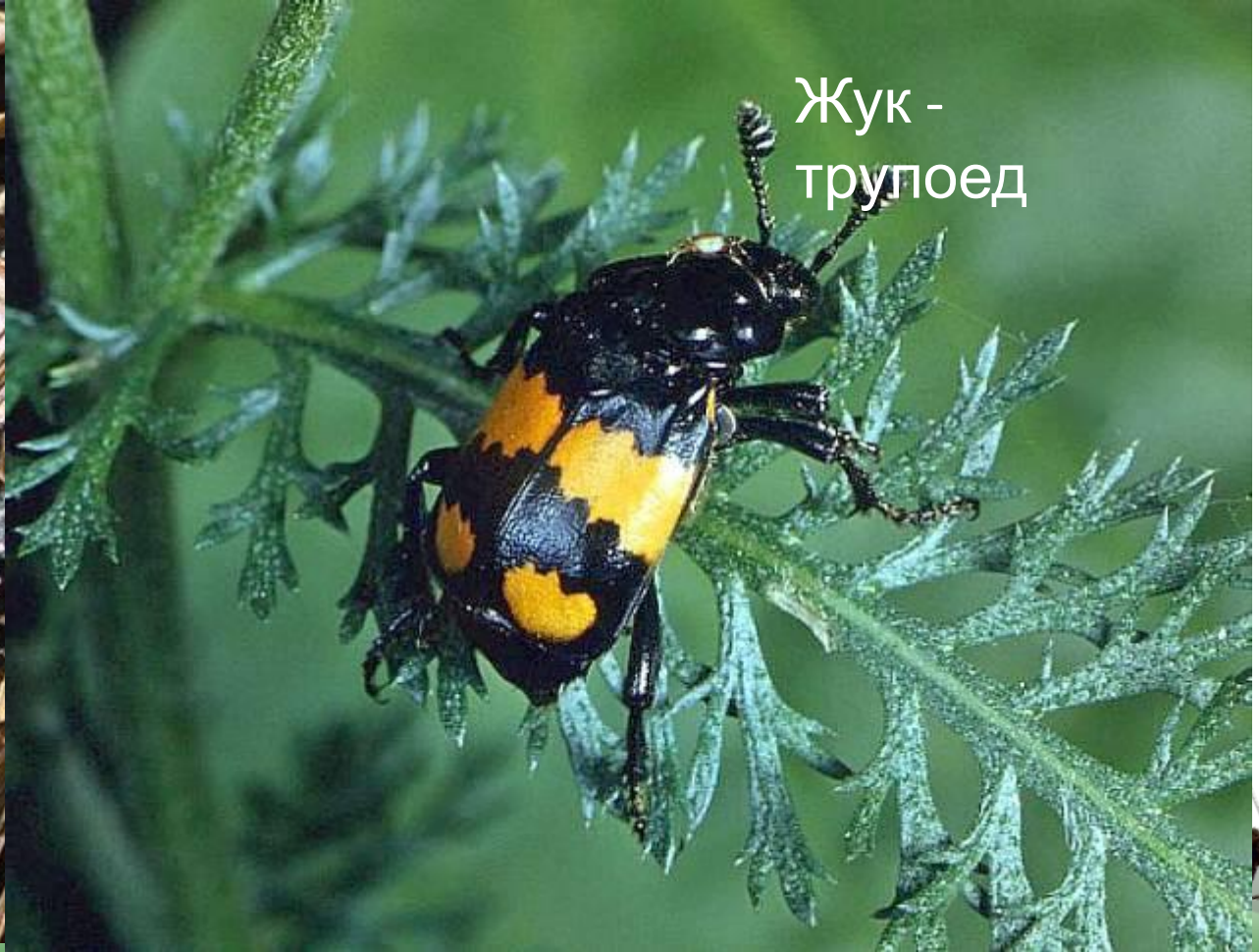
Жук - трупоед