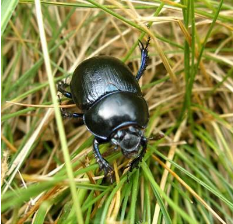
Жук - навозник

Жуки – навозники и скарабеи выполняют функцию санитаров, зарывая навоз в почву.