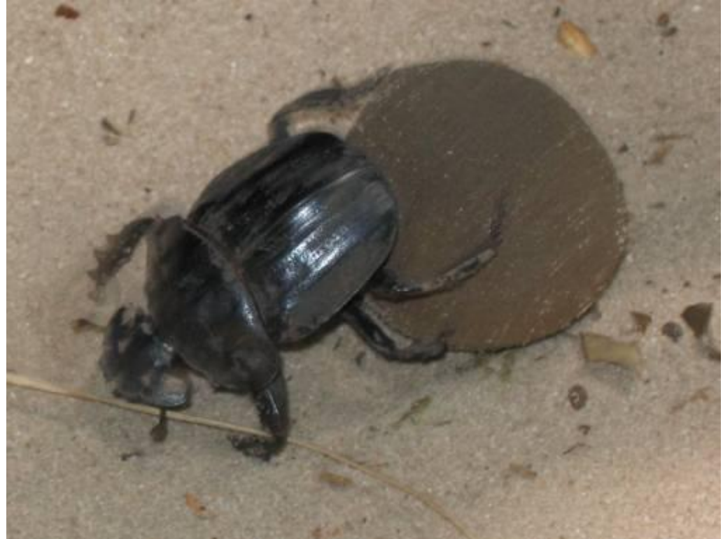
Жук - скарабей