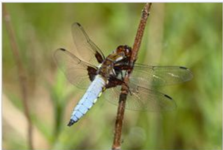
Стрекоза плоская ( Libellula depressa )