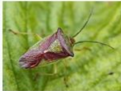
Килевик лиственный Acanthosomatidae

Теперь стало известно все про вшей и гнид, стрекоз, жуков и клопов, их обитании, существовании и питании. Эти знания помогут лучше понять окружающий нас мир.