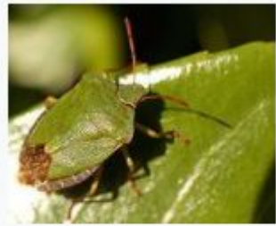
Щитник зелёный древесный Pentatomidae