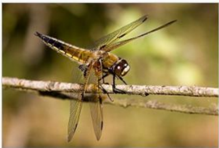
Четырёхпятнистая стрекоза ( Libellula quadrimaculata )