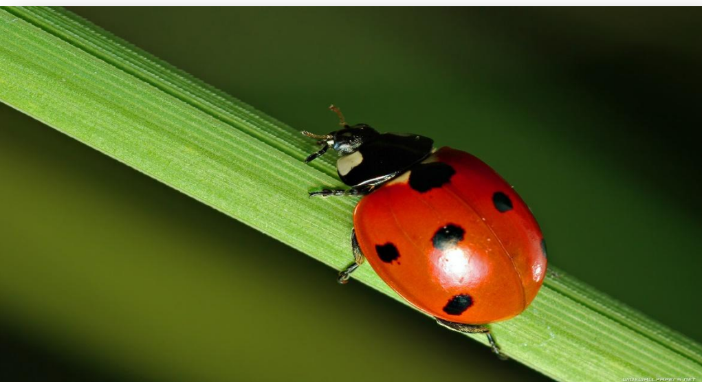
Жуки (божья коровка)