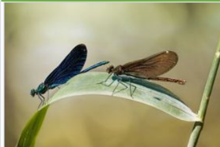
Красотка-девушка ( Calopteryx virgo )