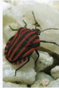
Щитник линейчатый Pentatomidae