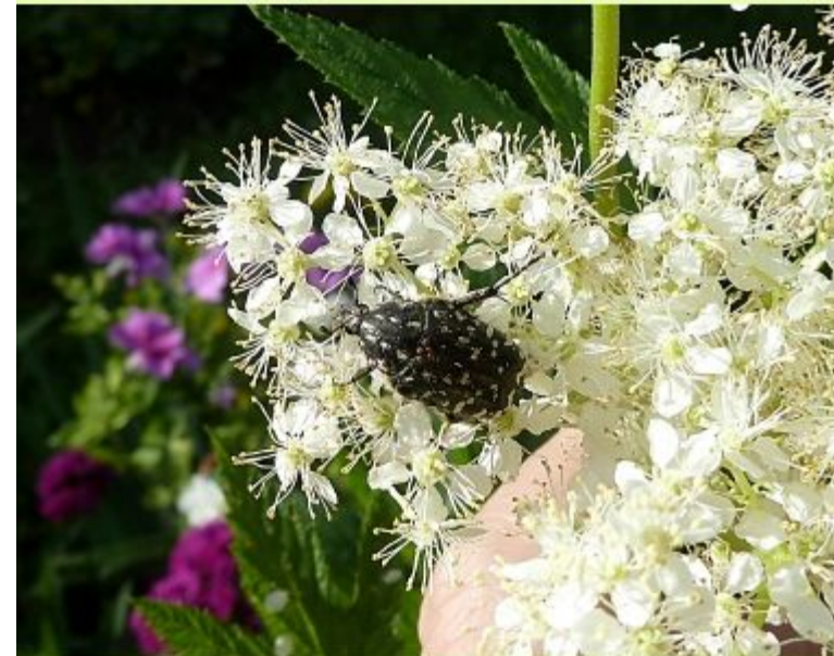
Жук бронзовка вонючая