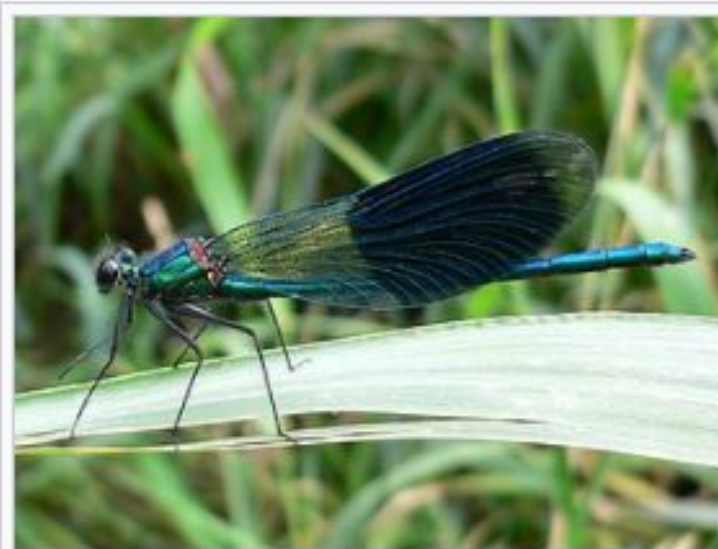
Красотка блестящая ( Calopteryx splendens )