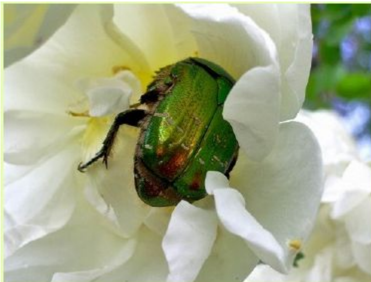
Жук золотистая бронзовка