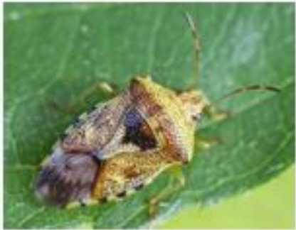
Щитник серый Acanthosomatidae