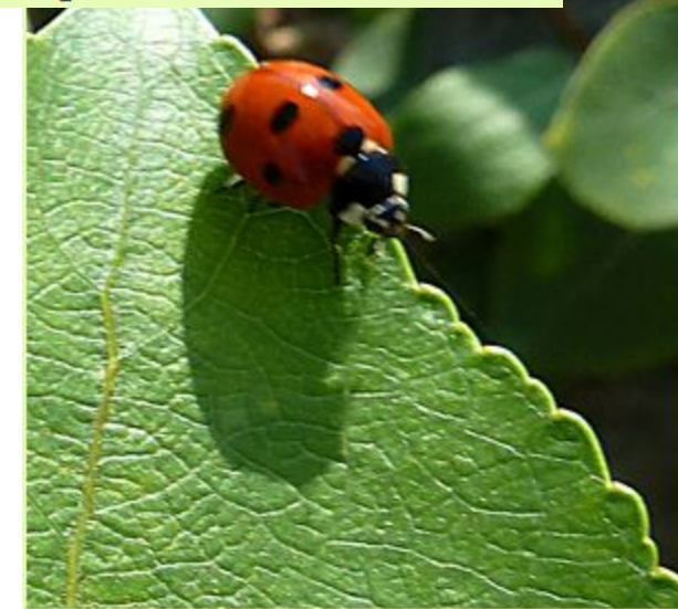
Жук божья коровка