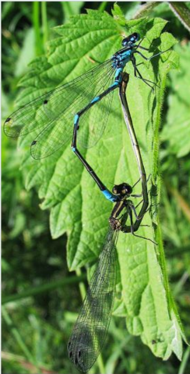
Стрелка красивая ( Coenagrion pulchellum )