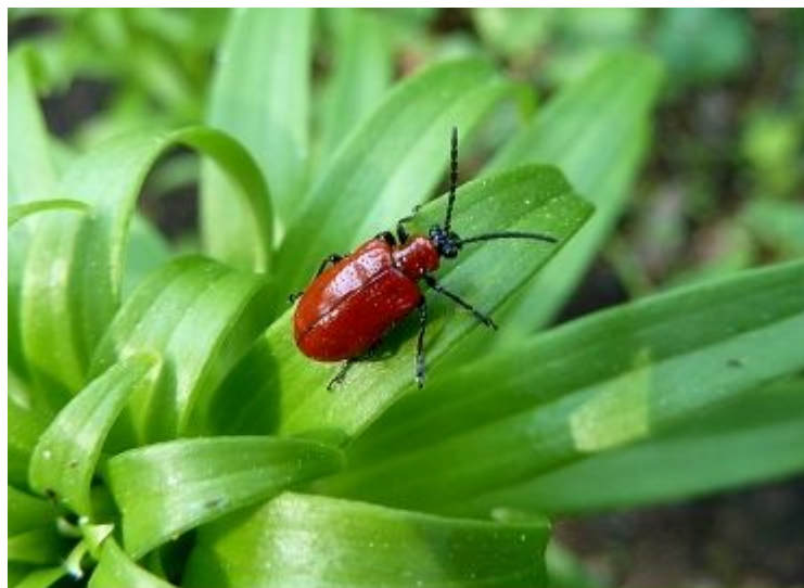
Жук трещалка лилейная