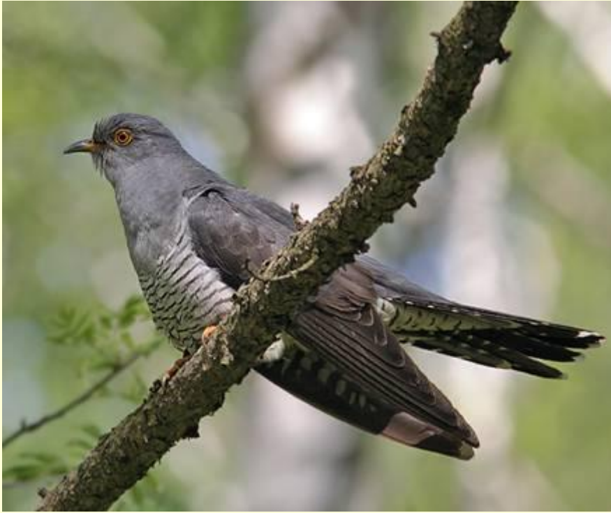
Обыкновенная кукушка-Cuculus canorus-Cuckoo.

http://nature.doublea.ru/index.php? p=100240151102