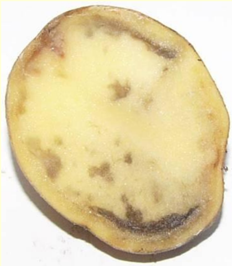
Phytophthora infestans - plisen bramborova

http://www.biolib.cz/cz/taxon/i d128812/