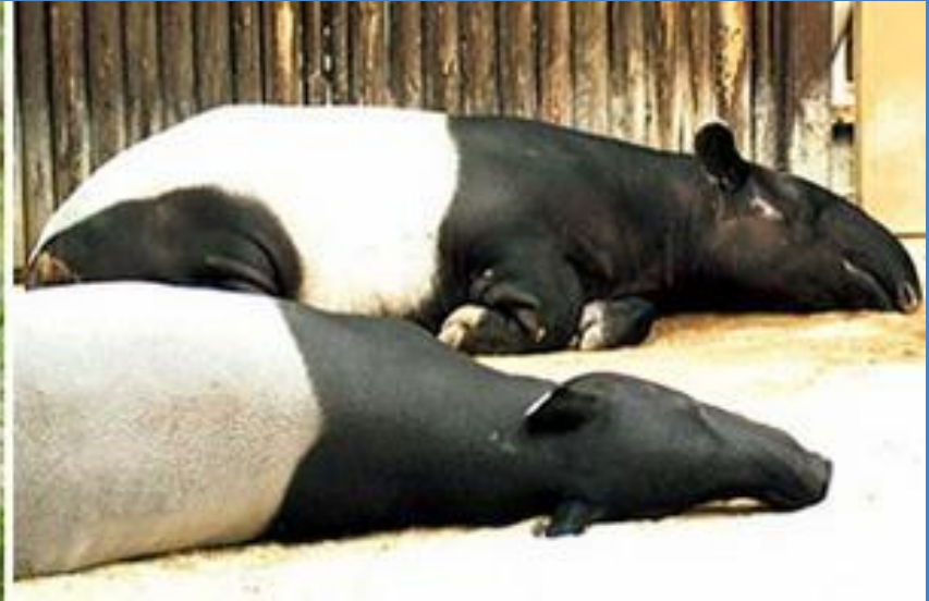
Непарнокопытные, семейство Тапировые. Слева - обыкновенный тапир, справа - чепрачный тапир