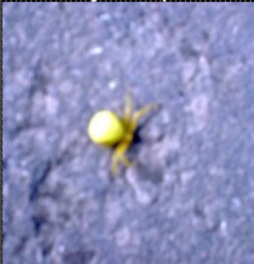
Бродячий Цветочный паук