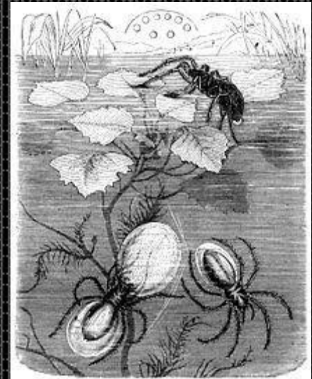
Водяной паук Серебрянка