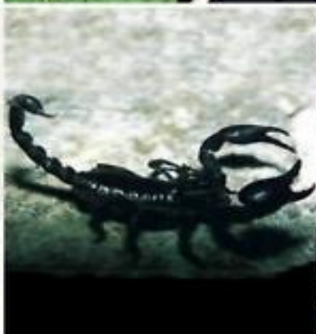
Саблевидны й скорпион