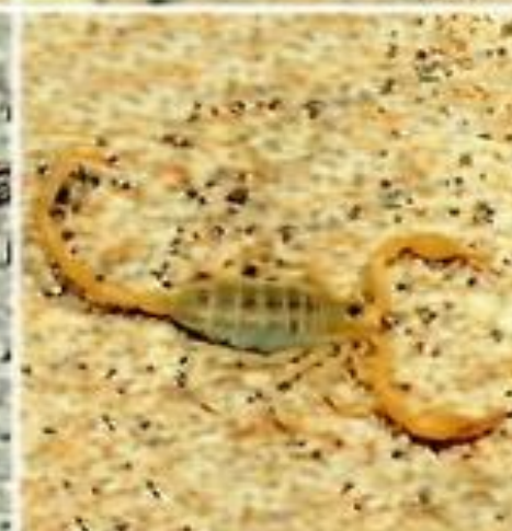
Смерингуру с скорпион