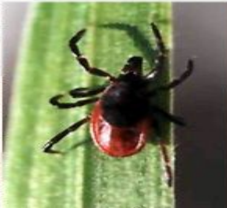
Паразитически й таежный