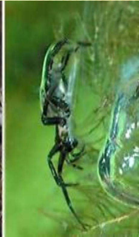
Водяной паук- серебрянка а