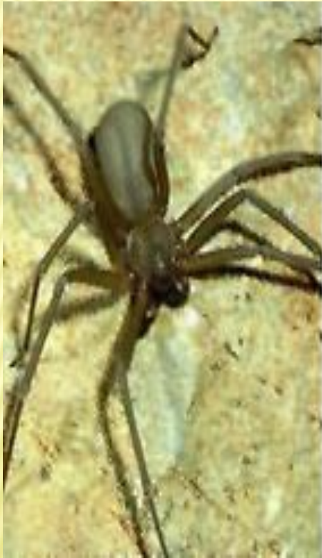
Коричневый паук- отшельник