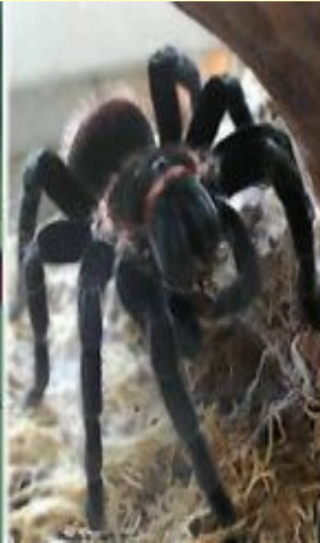
Красный мексиканский птицеед