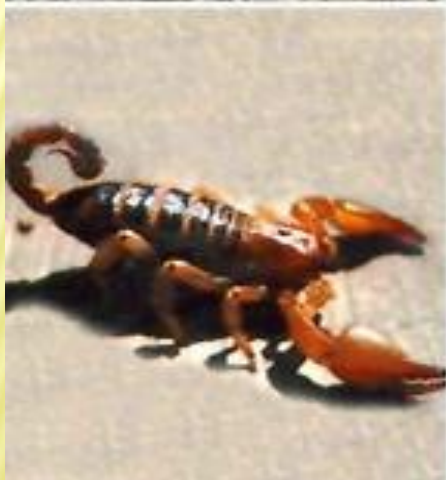
Африкански й скорпион