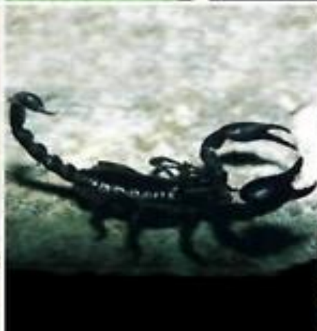
Саблевидны й скорпион