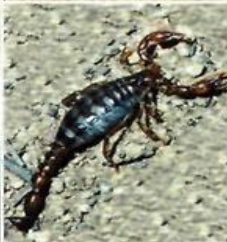
Суперститион ия скорпион