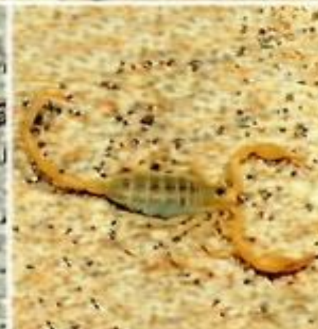
Смерингуру с скорпион