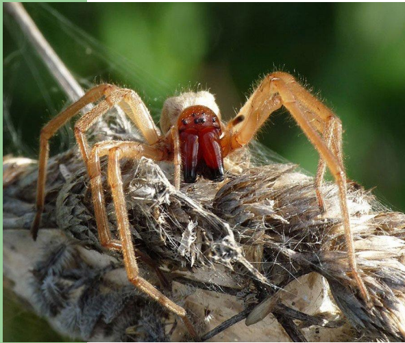
Желтые пауки Сак