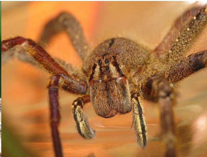
Бразильский странствующий паук