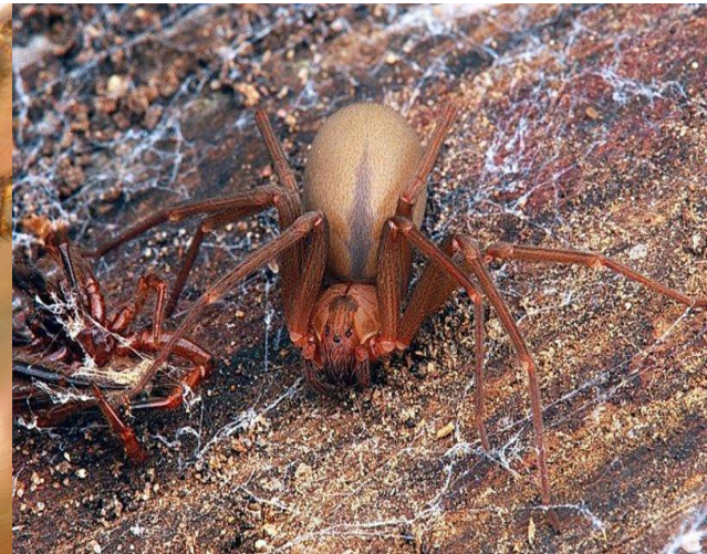
Коричневый паук отшельник