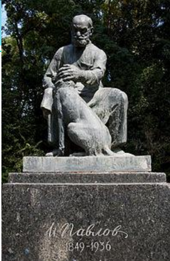
Памятник И. П. Павлову в городе Сухуми