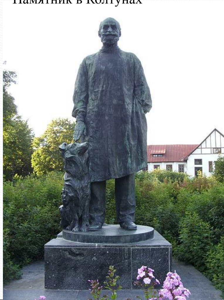
Памятник в Колтунах