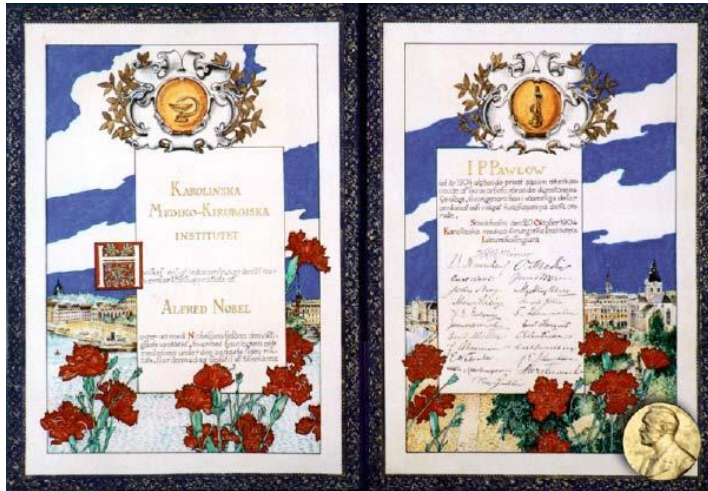
Диплом и золотая медаль лауреата Нобелевской премии 1904 года

В 1903 году 54-летний Павлов сделал доклад на XIV Международном Медицинском Конгрессе в Мадриде. И в следующем, 1904 году, Нобелевская премия за исследование функций главных пищеварительных желез была вручена И. П. Павлову, — он стал первым российским Нобелевским лауреатом