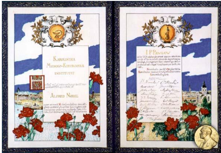
Диплом и золотая медаль лауреата Нобелевской премии 1904 года

В 1903 году 54-летний Павлов сделал доклад на XIV Международном Медицинском Конгрессе в Мадриде. И в следующем, 1904 году, Нобелевская премия за исследование функций главных пищеварительных желез была вручена И. П. Павлову, — он стал первым российским Нобелевским лауреатом