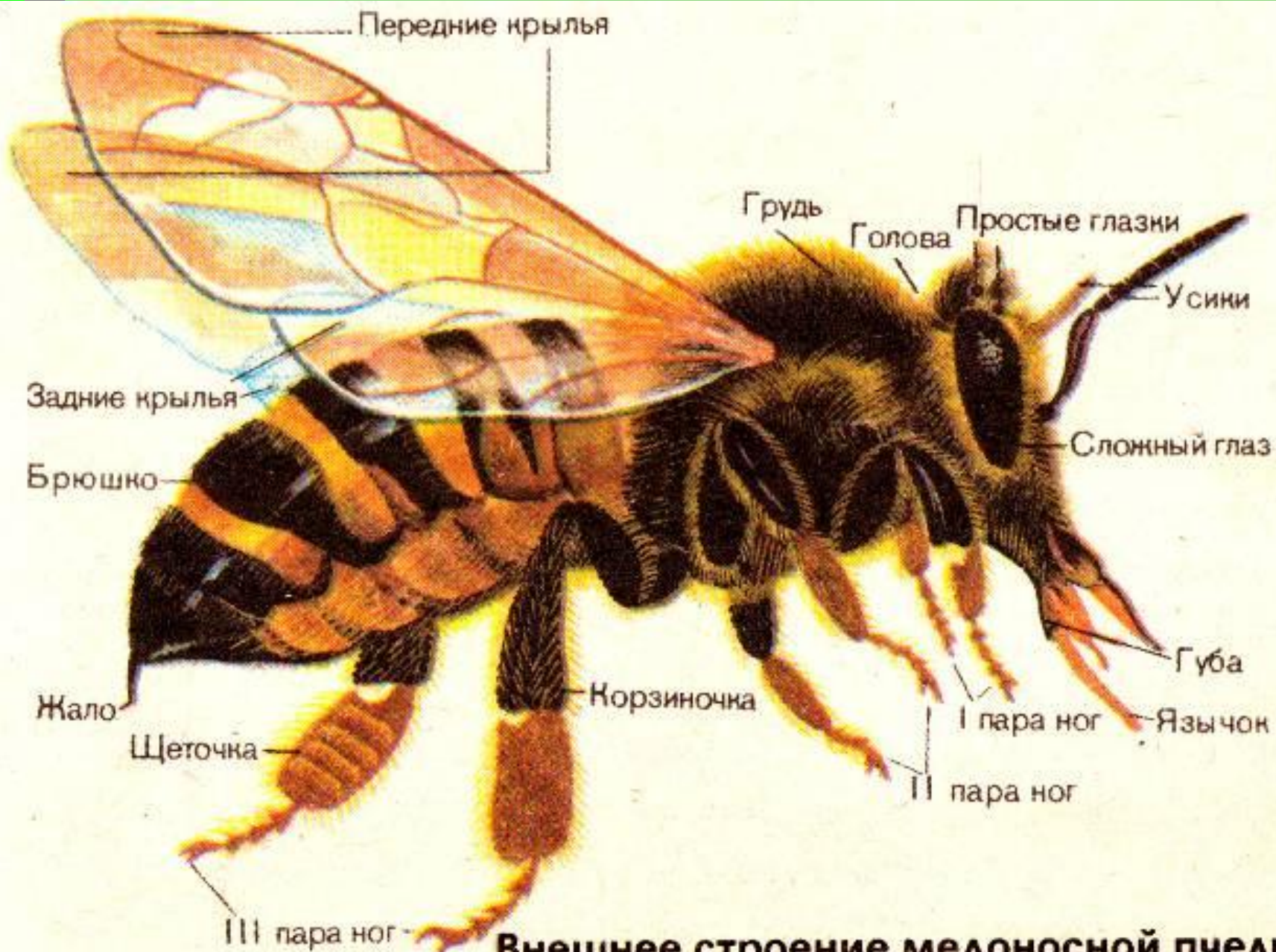
Внешнее строение медоносной пчелы