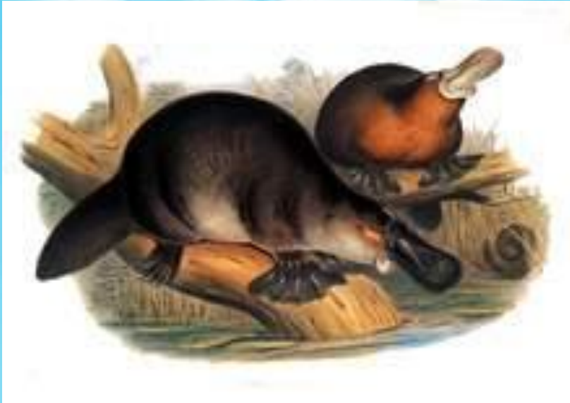
Утконос на рисунке XIX века