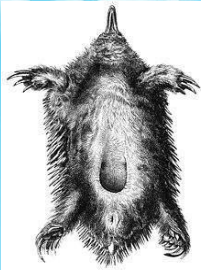
Выводковая сумка самки ехидны