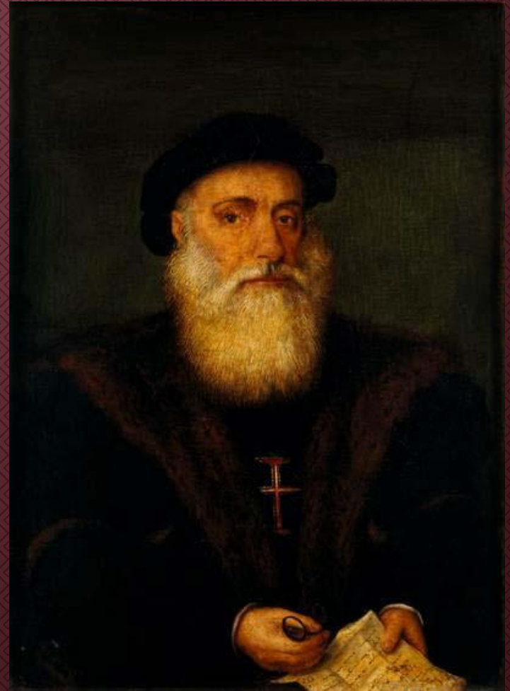
Васко да Гама

Через двадцать лет участник экспедиции Магеллана итальянец Антонио Пигафетта описал «странных гусей, которые держались вертикально и не умели летать». Он же затем сообщил, что птицы эти очень жирные. А так как жир по-латыни «пигвис», то птицы вскоре получили имя — пингвины.