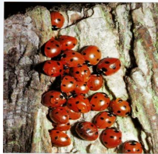
Божьи коровки – ярко окрашенные насекомые, живущие группами на растениях, пораженных тлей, которая составляет основу их питания. Только в центре Европы обитает около 30 видов божьих коровок.