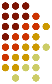
Схема переноса кислорода гемоглобином