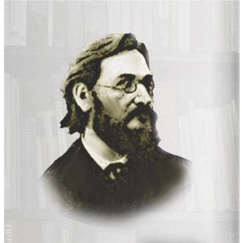
Мечников Илья Ильич

Создатель учения о фагоцитозе и теории происхождения многоклеточности - Илья Ильич Мечников в 1908 г. был удостоен Нобелевской премии за исследования флоры кишок.