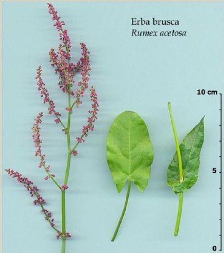
Erba brusca Rumex acetosa

продольно. Пыльцевые зерна от тр многопоровых.