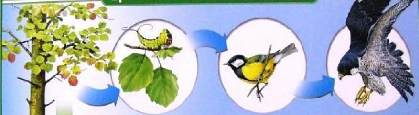
ПАСТБИЩНАЯ (выедания) ЦЕПЬ