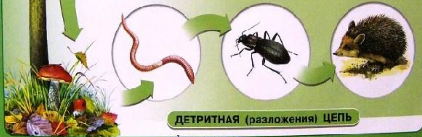
ДЕТРИТНАЯ (разложения) ЦЕПЬ