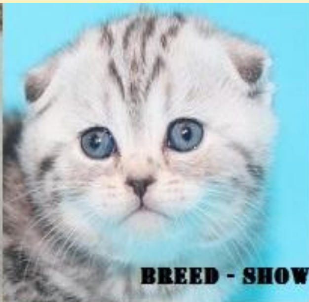
BREED - SHOW