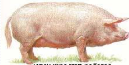
украинская степная белая