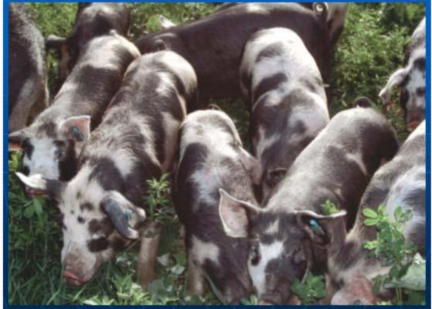
Поросята миргородської породи