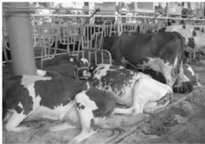
Українська червоно-ряба молочна порода