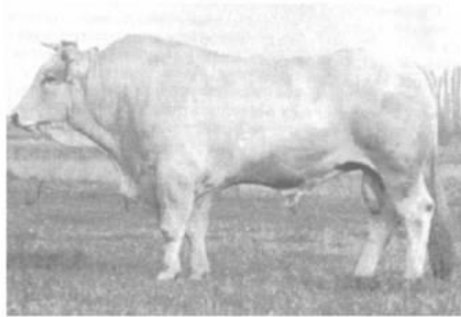
Українська м'ясна порода