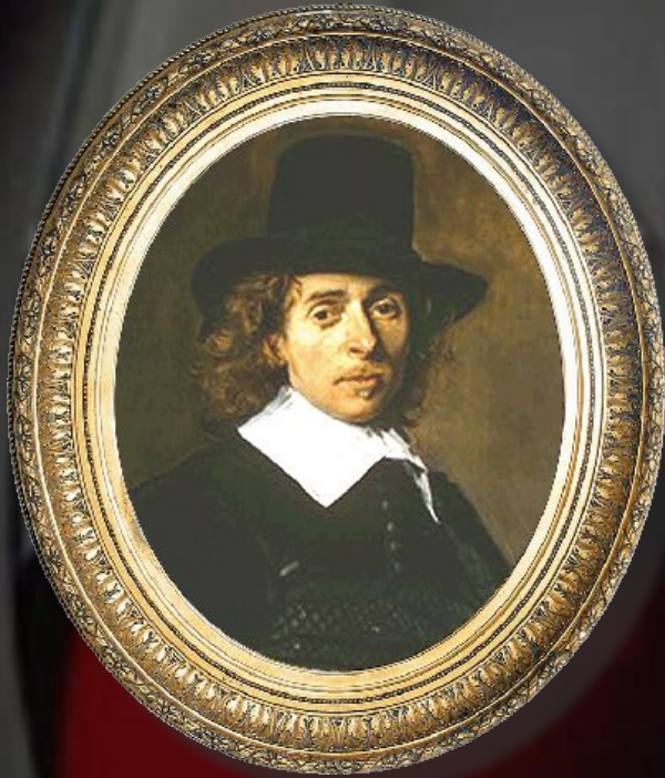
Андриан ван Остаде Голландия, XVII век