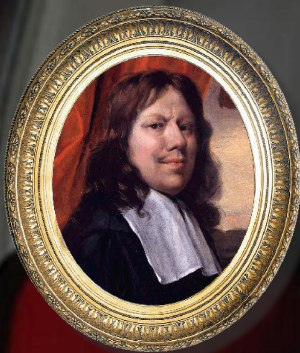
Ян Стен Голландия, XVII век