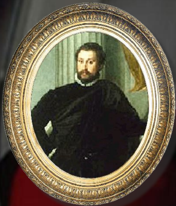
Паоло Веронезе Возрождение, XV век