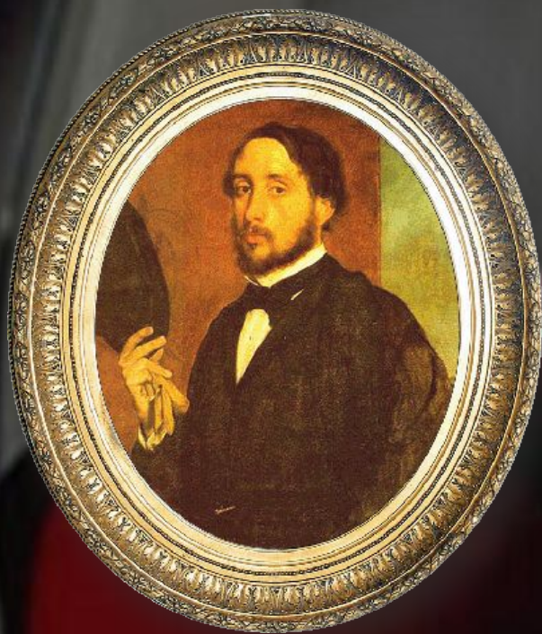
Эдгар Дега Франция, XVIII век