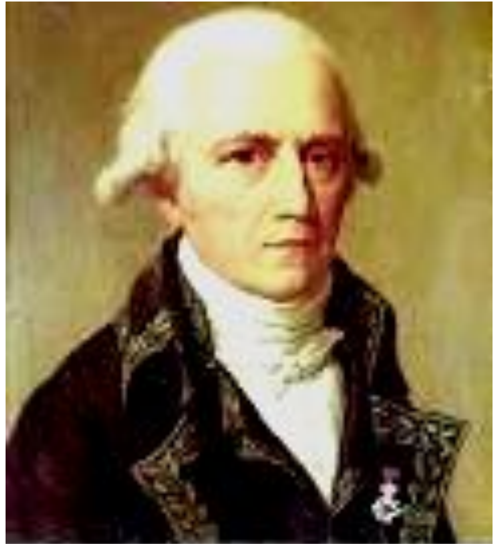
Жан Батист Ламарк

Б) Закон наследования благоприобретённых признаков.