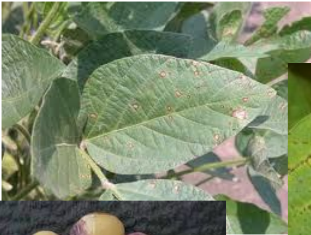
Церкоспороз Cercospora sojina