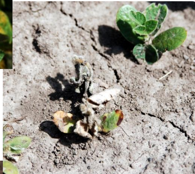
Фузаріоз сої Fusarium oxysporum , F. solani , F. gibbosum , F. avenaceum ,