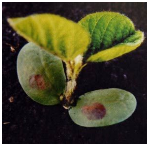
Бактеріози Пустульний бактеріоз Углова плямистість Бактеріальний опік комплекс