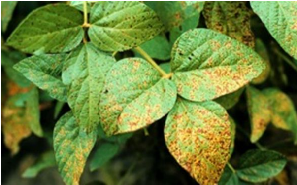
Септоріоз сої Septoria glycines