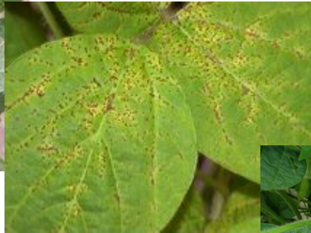
Іржа Uromyces sojae ,