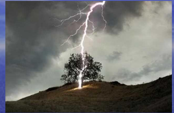
ОДИНОКО СТОЯЩЕЕ ДЕРЕВО